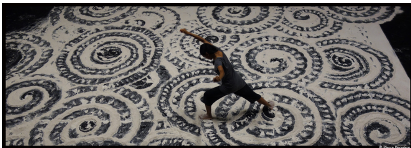
Au Festival Montpellier Danse, Aurélien Bory fait danser Shantala Shivanlingappa

Corps fluide, gestuelle aérienne, exécutée avec une précision chirurgicale, Shantala Shivalingappa invite avec une grâce infinie à remonter le fil de son histoire singulière autant que plurielle. Réécrit par les talents de poète d'Aurélien Bory, le récit de cette vie, entre tradition et danse contemporaine, envoûte les sens et entraîne les spectateurs dans une balade aux confins du réel. Magique !