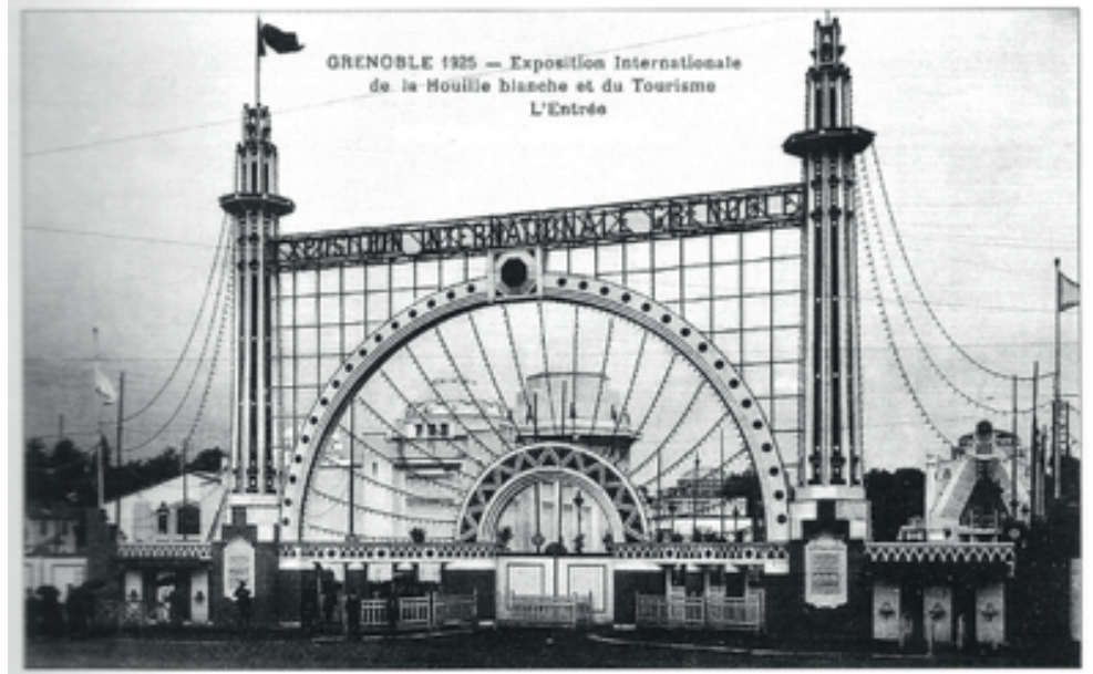
L'entrée monumentale de l'Exposition Internationale de la Houille blanche et du Tourisme

SAVIEZ-VOUS QUE LA PREMIÈRE EXPÉRIENCE D'ÉLECTRICITÉ PUBLIQUE AU MONDE S'ÉTAIT DÉROULÉE A GRENOBLE ?