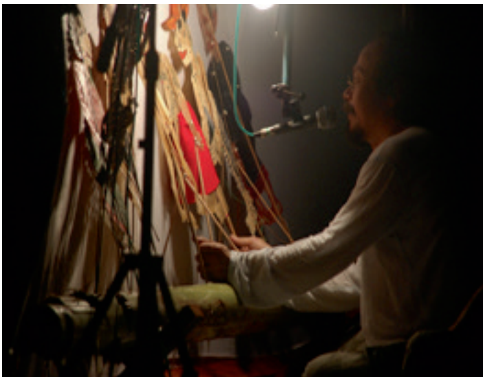
Vasan Sittthiket shadow play, Trang, 2008